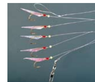
5 horgokkal és ütközőkkel