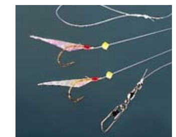
2 horoggal és ütközőkkel